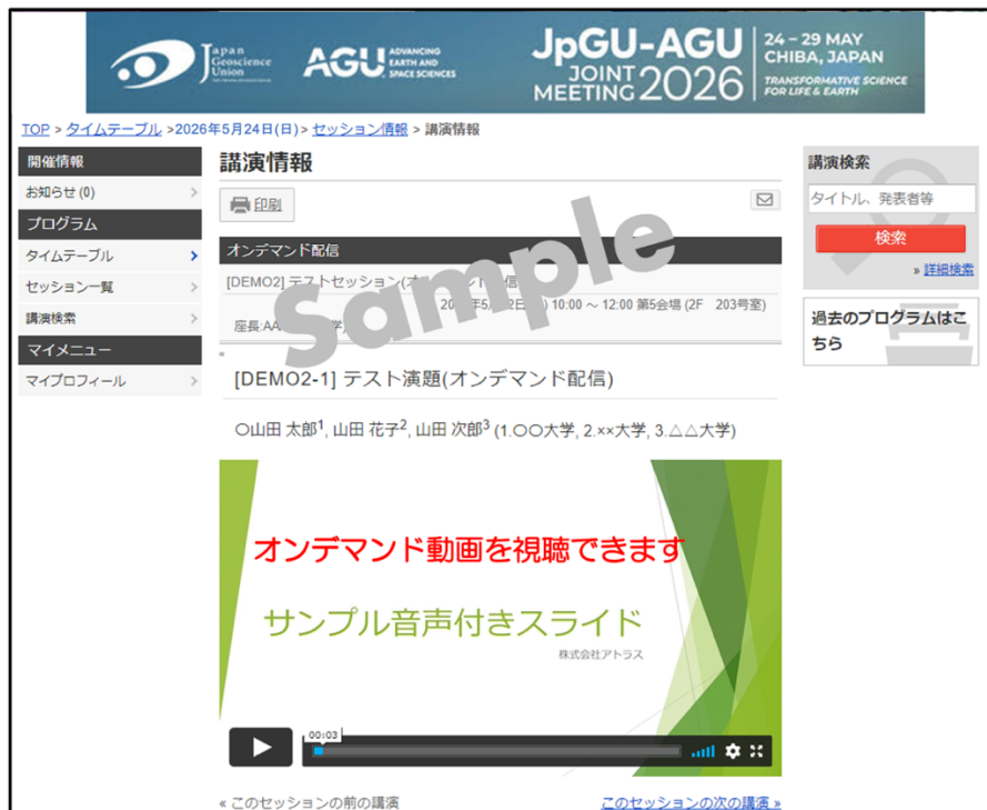
図4：オンデマンド動画視聴（サンプル）