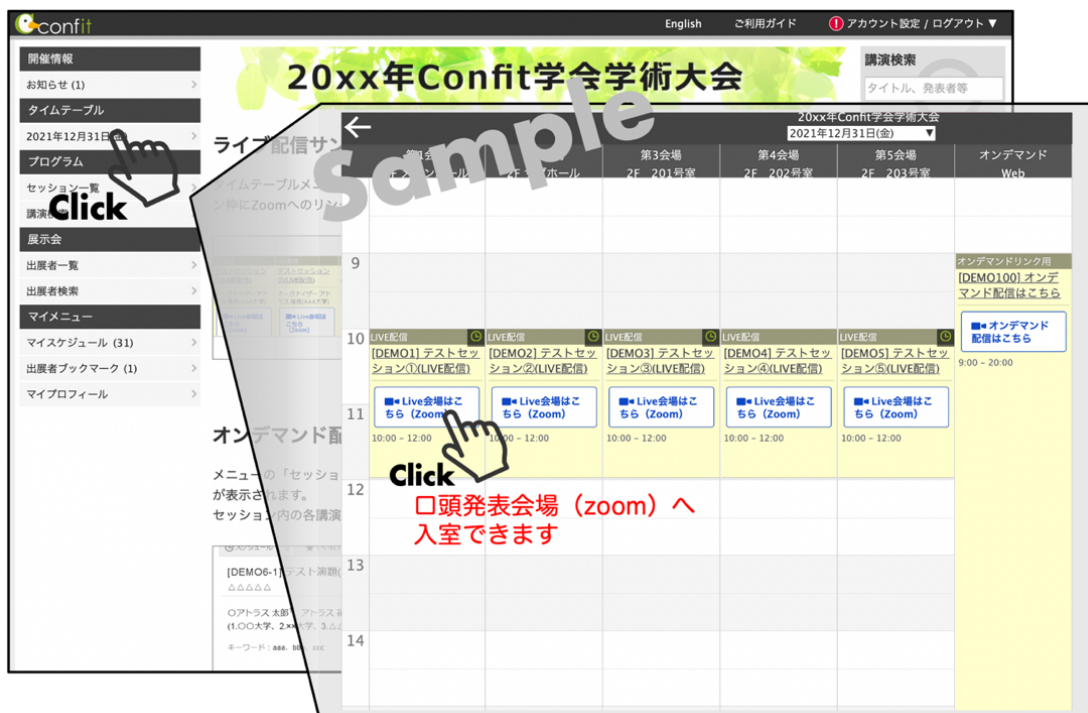
図3：オンライン口頭発表会場（Zoom）への入室（サンプル）