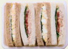
⑥ サンドウィッチ BOX（ツナ&たまご）