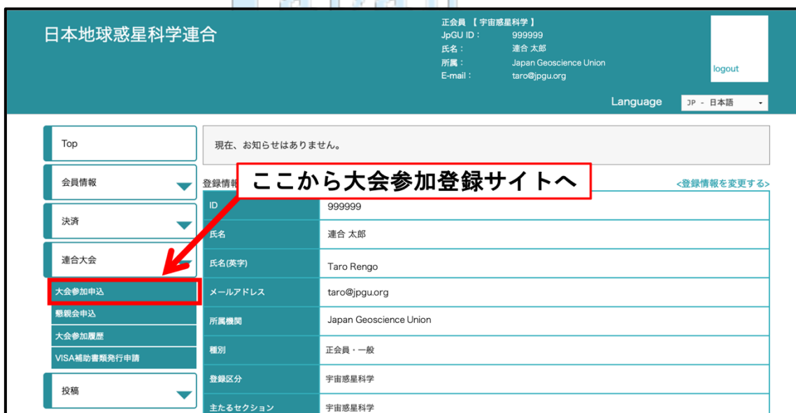
図 1：JpGU 会員サイトから大会参加登録サイトへ