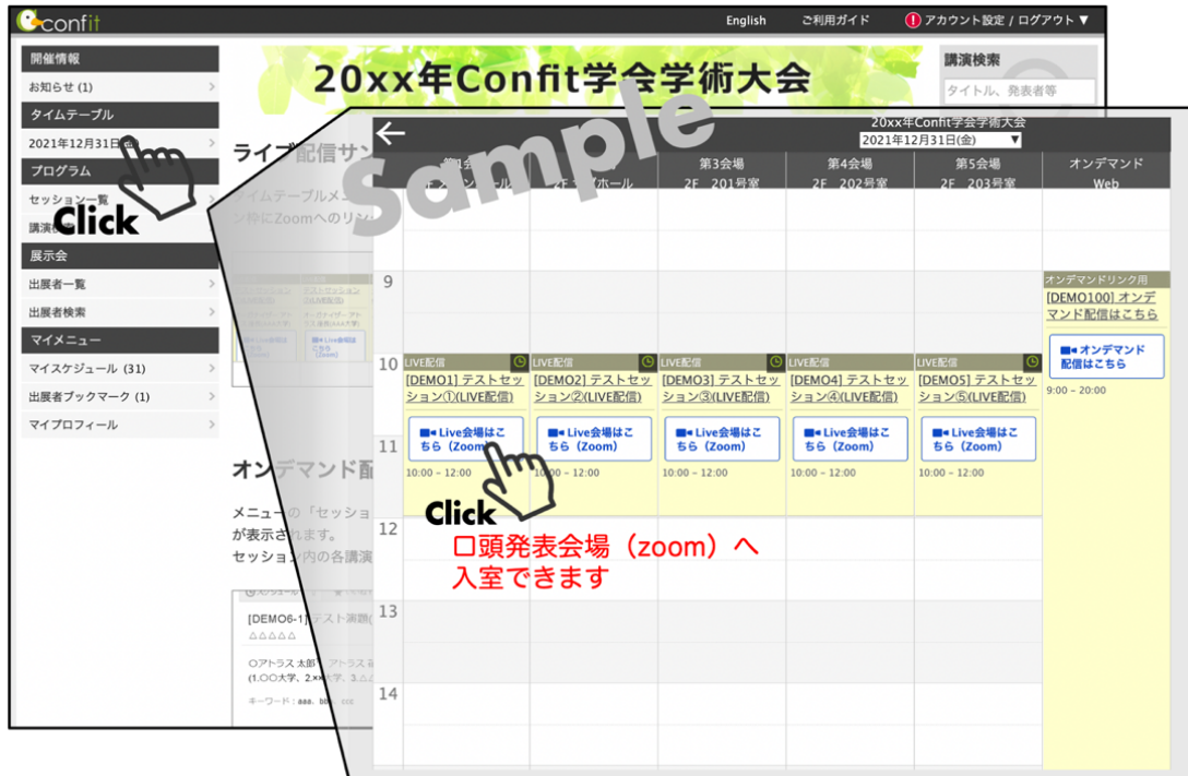
図3：オンライン口頭発表会場（Zoom）への入室（サンプル）