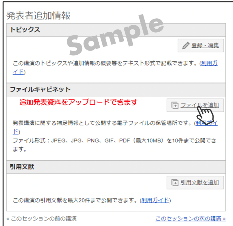
図5：追加発表資料アップロード（サンプル）