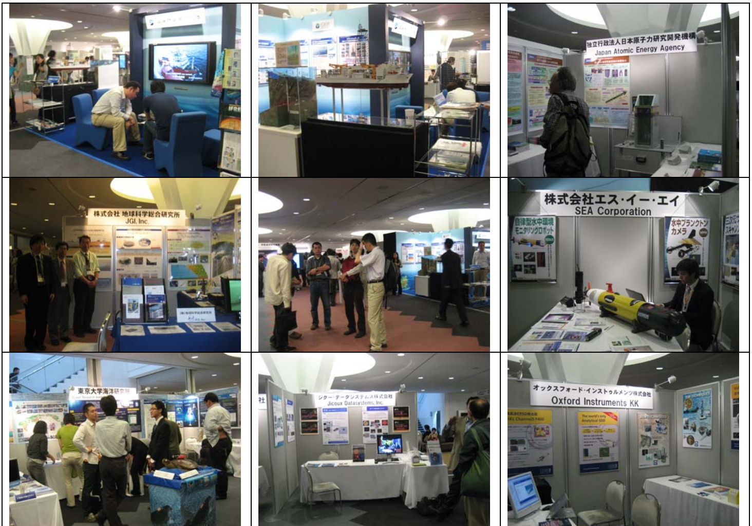
日本地球惑星科学連合 2008 年大会 団体展示ブース 2F 中央ロビーレイアウト